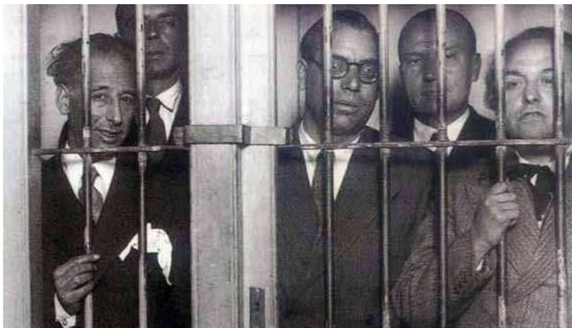
Companys, amb membres del Govern, empresonat després dels fets del 6 d'octubre de 1934.

El 14 d'abril va proclamar la república des del balcó de l'Ajuntament i seguidament, nomenat provisionalment governador civil de Barcelona. Escollit diputat a les Corts Constituents de la Segona República, el 1932 fou escollit diputat al Parlament de Catalunya, esdevenint el primer president del Parlament. Durant uns mesos del 1933 va ser ministre de Marina del govern espanyol. Amb la mort, sobtada, de Francesc Macià el dia de Nadal del 1933, Companys va ser investit president de la Generalitat l'1 de gener del 1934. El 6 d'octubre, en resposta a l'entrada al govern de la República de la Confederación Española de Derechas Autónomas (CEDA) proclamà l'Estat Català dins de la República Federal Espanyola des del balcó del Palau de la Generalitat, un pronunciament que seria sufocat i acabaria, l'endemà, amb l'Estatut suspès i Companys i tot el seu Govern arrestats al vaixell Uruguay. D'aquest empresonament són les cèlebres fotografies de Companys entre reixes.