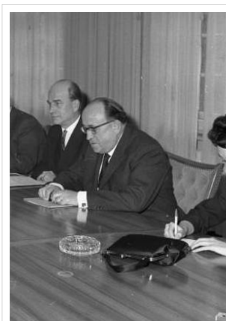
Alfred Müller-Armack (centro) 1961.

Según Ingo Pies, siguiendo las instrucciones de Müller-Armack, se puede decir con mucha claridad y en detalle lo que la política no debería hacer. En todo caso, con eso solo se pudiera asignar el principio de la intervención política, pero no la intensidad de su aplicación. [57] Heiko Körner opina que Müller-Armack “no haya hecho exclamaciones concretas sobre principios y elementos de una ‘política social conforme con el mercado’ . Según Körner “cada persona interpretando este ‘modelo ejemplar abierto para interpretaciones’ pudiera dar importancia según sus intereses y preferencias políticas ‘en un área conflictiva de eficiencia económica en un lado y equidad social en el otro lado’ .” [58] Friedrum Quaas ve como elemento continuo en “los trabajos de Müller-Armack le relación entre el